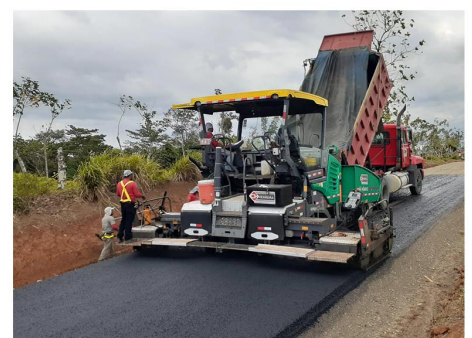
Chambacú - La Orquídea