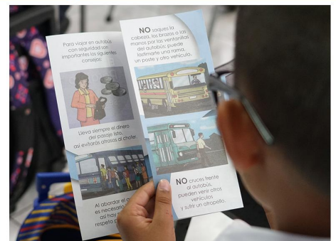
Seguridad vial escolar