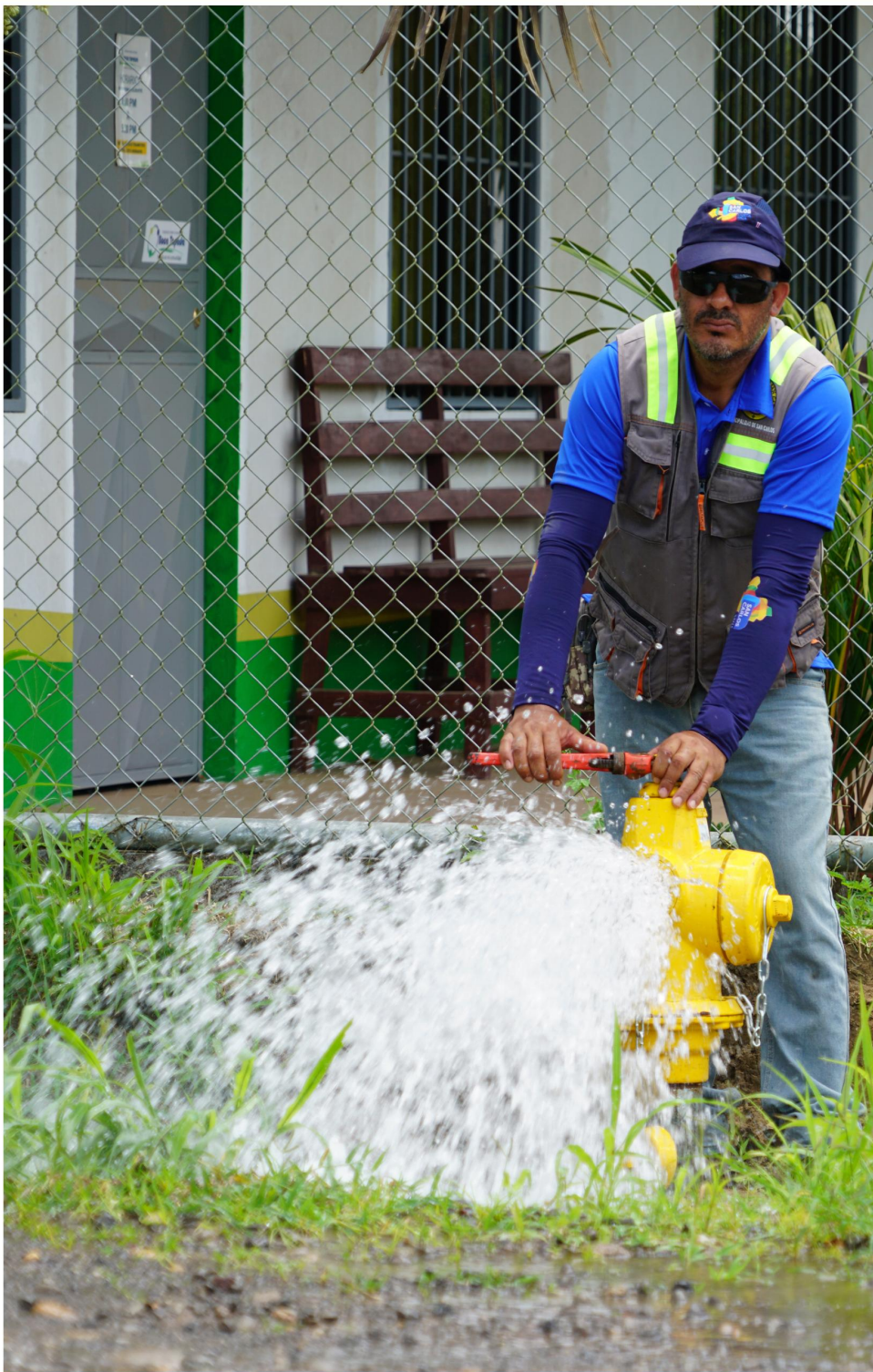
Agua potable hasta Boca Tapada