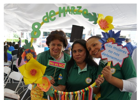
Día de la Mujer